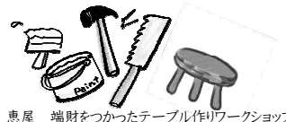
恵屋 端財をつかったテーブル作りワークショップ

こごんまり百貨店とは・・・ 毎月、最終日曜日に開かれる ちいさな市場です。 のんびり遊びに来て下さいね。