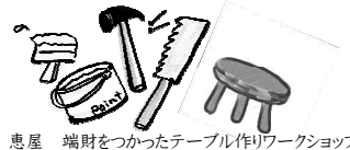
恵屋 端財をつかったテーブル作りワークショップ

こごんまり百貨店とは・・・ 毎月、最終日曜日に開かれる ちいさな市場です。 のんびり遊びに来て下さいね。