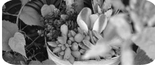
FloraRIE 多肉植物寄せ植え ワークショップ

駐車場は、おとなりの テクノワークスさん、レンティさん、 ムラキさんをご利用いただけます。