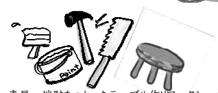
恵屋 端財をつかったテーブル作りワークショップ

こごんまり百貨店とは・・・ 毎月、最終日曜日に開かれる ちいさな市場です。 のんびり遊びに来て下さいね。