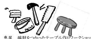
恵屋 端財をつかったテーブル作りワークショップ

こごんまり百貨店とは・・・ 毎月、最終日曜日に開かれる ちいさな市場です。 のんびり遊びに来て下さいね。