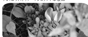
FloraRIE 多肉植物寄せ植え ワークショップ

駐車場は、おとなりの テクノワークスさん、レンティさん、 ムラキさんをご利用いただけます。