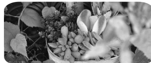
FloraRIE 多肉植物寄せ植え ワークショップ

駐車場は、おとなりの テクノワークスさん、レンティさん、 ムラキさんをご利用いただけます。