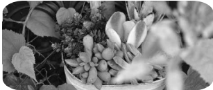
FloraRIE 多肉植物寄せ植え ワークショップ

駐車場は、おとなりの テクノワークスさん、レンティさん、 ムラキさんをご利用いただけます。